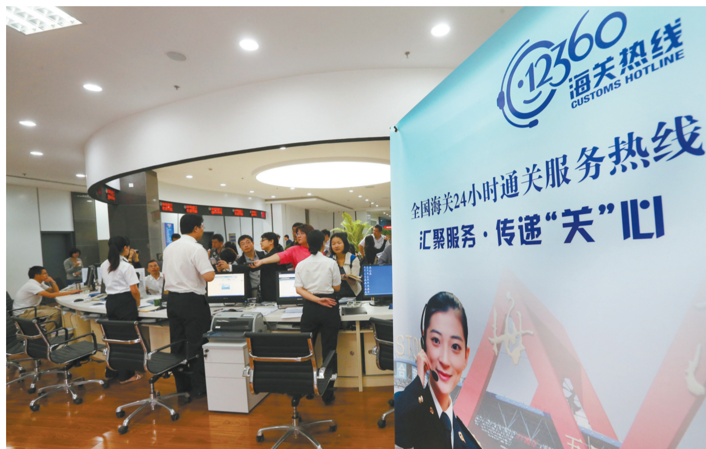
上海自贸区各项便利化措施大大提高了通关效率,降低了企业成本。