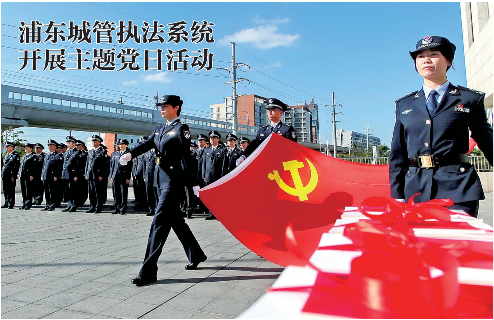
浦东新区城管执法系统开展主题党日活动。

本报讯(记者 黄静)昨天上午,浦东新区城管执法局开展浦东城管执法系统主题党日活动,现场进行了升国旗、唱国歌、重温入党誓词的仪式。此次活动既是学习贯彻党的十九大精神一次实际行动,也是在全区城管执法系统迅速掀起学习贯彻党的十九大精神的一次思想动员。