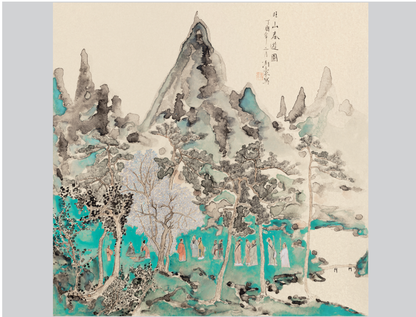
旺山春游图(国画) □冯豪