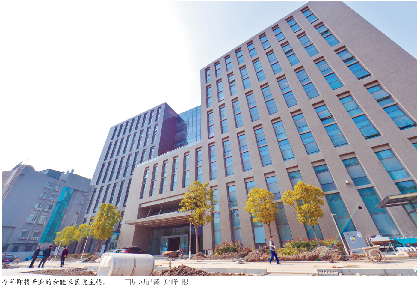
今年即将开业的和睦家医院主楼。

事实上,上海首家中外合作综合性医院就是东方医院的“院中院”。此外,浦东还拥有国内唯一一家外资独资医院——2015年开业的上海永远幸妇科医院,该院位于外高桥,日资独资,特色为不孕不育。