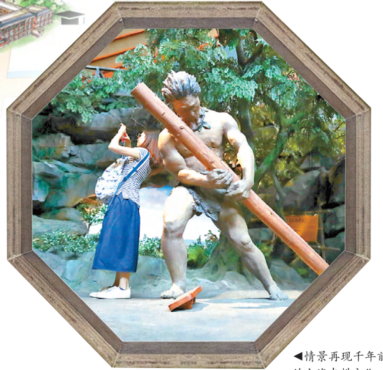
◀情景再现千年前的上海农耕文化。