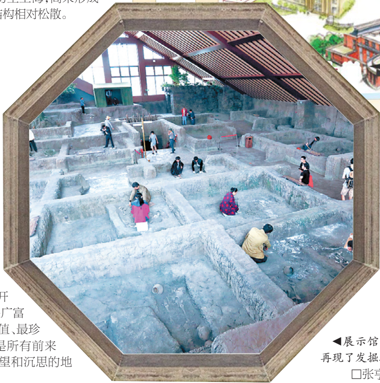
◀展示馆内真实再现了发掘现场。

这栋建筑其实是一家书店——朵云书院,上架图书侧重于文史、书画、古籍等领域,也有符合孩子们口味的绘本连环画册。书院内还有文创体验区、品茗休闲区等,书店将不定期更新和推出一些文创体验活动。这里还展出了众多古籍善本,以及良渚文化黑陶鱼鳍三足鼎、夏朝时期白陶印纹龟等诸多珍品,黑到发亮的黑陶,看上去犹如青铜器,体现出中国古代高超的制陶技艺。