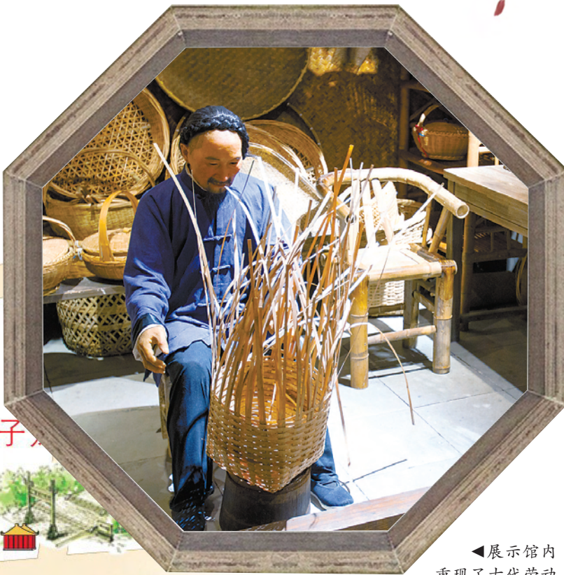
◀展示馆内重现了古代劳动人民的生活。