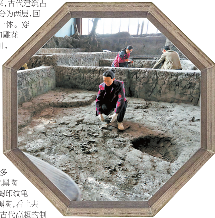
▲栩栩如生的发掘现场。