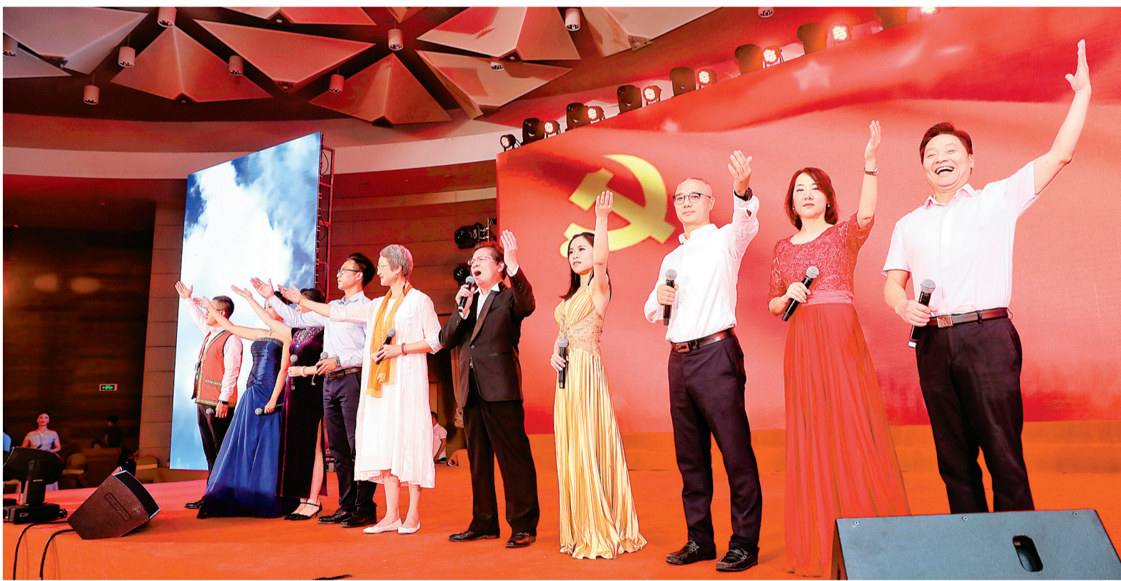
经典歌曲串烧《时代之音》在联谊会上赢得了阵阵掌声。