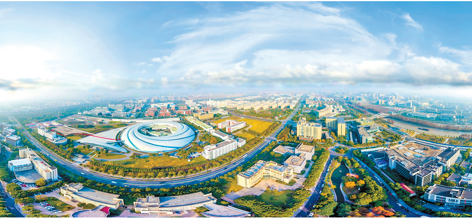
从空中俯瞰位于张江的上海光源。

如今的张江,汇集一群群创造者,已成为活力四射、日益接近世界“最优最强”科技的地方