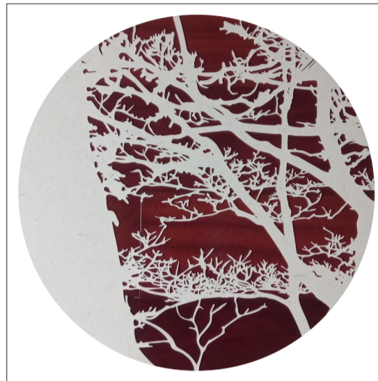
《LOST IN A CIRCLE》系列 □资料图