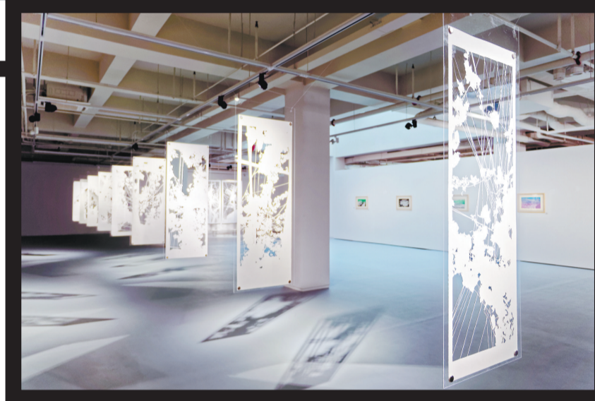
9件手工刻纸作品构成一条光影长廊。