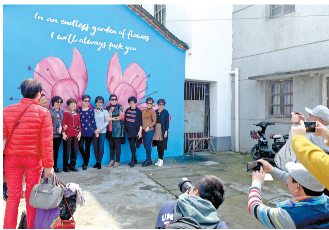
“网红”墙绘吸引游客合影留念。

一年一度的上海桃花节，不再是一次短期的节庆狂欢，而成为了吹暖乡村振兴的缕缕春风。