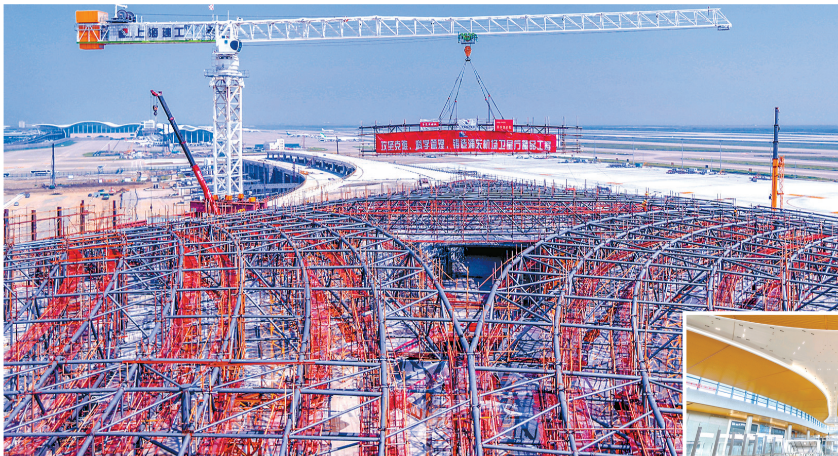
浦东机场卫星厅钢屋盖大跨度桁架。

“客户在哪?应用场景在哪?这是初创型金融科技企业面临的巨大难点,未来,陆家嘴金融城将建立政府引导、市场主体参与的共建共治模式,帮助各类持牌金融机构发布需要科技赋能的具体应用场景,推动金融科技企业对接金融机构的科技诉求,构建场景触发与技术驱动相结合的金融科技新生态体系。”上海自贸区陆家嘴管理局航航处处长袁冶锋说。(下转2版)