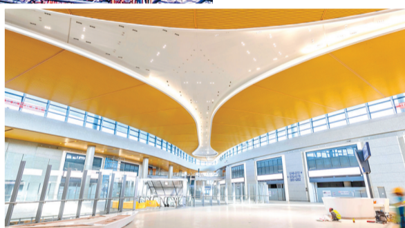
浦东机场卫星厅三角形大跨度钢屋盖。

浦东机场卫星厅位于浦东机场T1、T2两座航站楼南侧,总建筑面积62.2万平方米,是目前世界上最大单体卫星厅,其用钢量是上海徐浦、杨浦、南浦3座大桥钢结构重量的总和,共计3.5万吨。(下转2版)