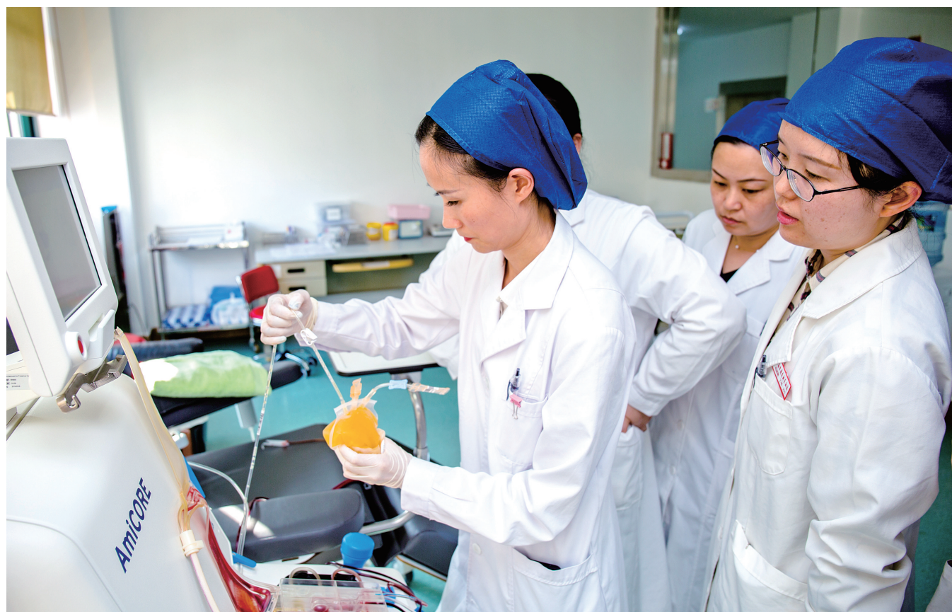
采集到血小板后,其余血液重新回到献血者体内。

浦东的23户“海上最美家庭”用大爱、爱岗敬业、公益、勤劳友善、孝亲和睦、绿色环保等良好家风,展现了浦东百万家庭的“美美与共”。据悉,2014年以来,全市各级妇联组织通过组织开展写家史、续家谱、议家训、树家教、展家风、说家事、秀家宝、晒家书等活动,在全市寻找各级各类“最美家庭”近7万户。