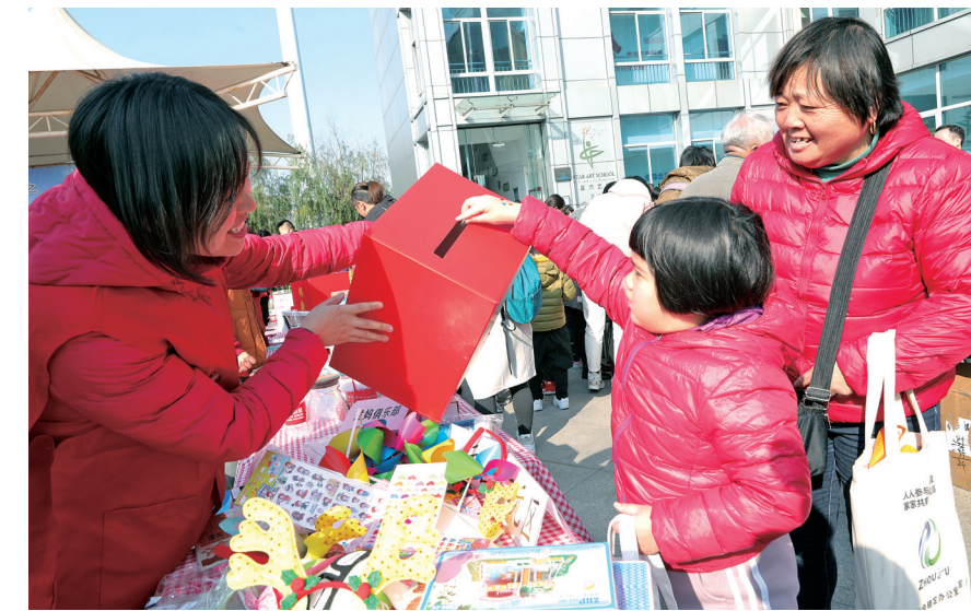
小朋友在爱心集市参与慈善捐款活动。

本报讯(记者 沈馨艺)12月7日,周浦镇一场公益徒步拉开了2020年慈善公益联合捐的帷幕。当天,爱心人士踊跃捐款,所筹善款将用于周浦安老、扶幼、助学、济困等各项慈善公益项目。 爱心集市、慈善公益嘉年华、慈善大道……作为慈善联合捐的预热环节,现场40多个摊位汇聚了居民区、镇残联、镇慈善超市等多家公益机构组织,以爱心义卖的形式为联合捐助力。同时,现场还设置了《慈善法》、垃圾分类、周浦文化等相关知识问答及互动游戏体验,让更多居民参与慈善,拥抱慈善。 慈善公益联合捐启动仪式上,周浦镇向全镇发出倡议,号召大家向特困群体伸出关爱之手。上海佳朋房地产开发有限公司等辖区16家企业现场捐款,以实际行动回报社会。上海申茂电磁线有限公司连续多年参与周浦镇慈善联合捐行动,此次公司捐款10万元。公司董事长陆惠芳说:“参与公益事业也是公司社会责任感的体现,希望这些爱心能为困难群体送去温暖。” 近年来,周浦在助学、扶幼、济困等