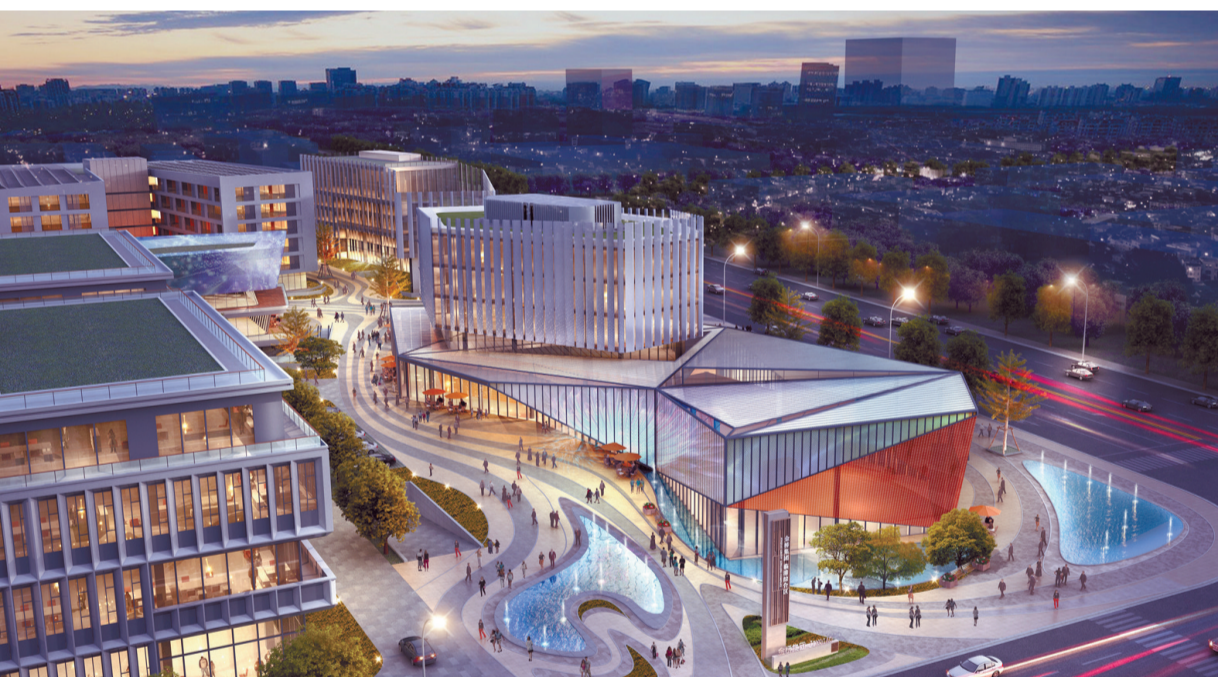
金桥集团临港项目效果图。

据悉,金桥集团2012年控股设立上海金桥临港综合区投资开发有限公司,首期注册资本15亿元,负责临港综合区42平方公里区域土地开发、基础设施、招商引资、产业规划、功能配套的一体化开发运营,