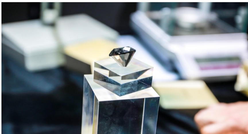
88克拉的“传奇黑钻”将在第三届进博会上向公众揭开神秘的面纱。

10月23日凌晨4时许,卡洛美88黑钻搭乘瑞士航空LX188航班运抵上海浦东国际机场。为保障这颗黑钻和卡洛美公司其他参加进博会展出珠宝的快速通关,上海浦东国际机场海关提前对接展商和承运商,建立专项保障微信群,掌握展品航班进出港计划,实时监控卸货、理货、分拨、存储、提离各环节运行情况,派人员加班加点完成放行确认、舱单删改等工作,最大化压缩展