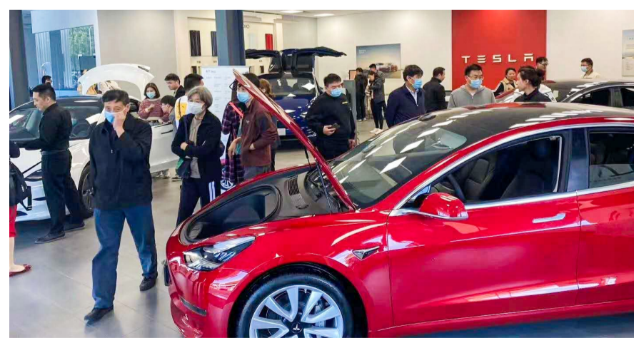
新能源汽车展厅里,前来选购和了解信息的消费者众多。

前不久,中国汽车工业协会发布最新汽车工业产销情况。数据显示,9月,我国汽车市场进入传统旺季,产销双双超过250万辆,创年内新高。其中,新能源汽车