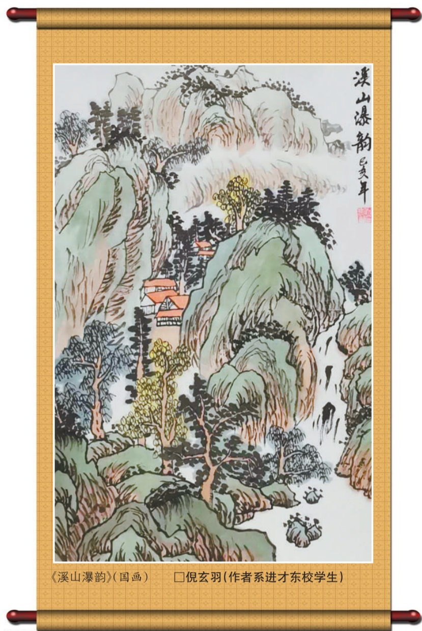
《溪山瀑韵》(国画) □倪玄羽(作者系进才东校学生)