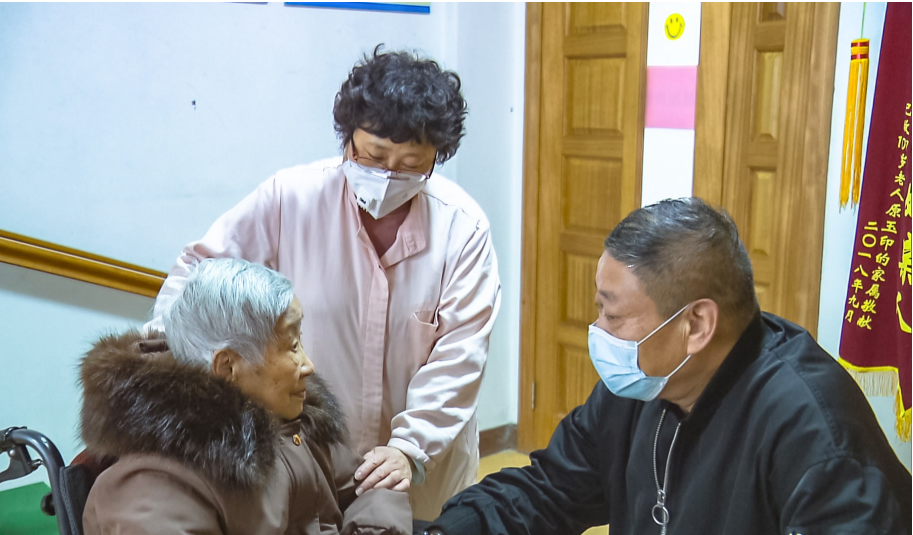
恢复预约探视后，家属与老人又能面对面交流了。 □王杨 摄

据悉，恢复预约探视后，各养老机构可结合自身设施条件和接待能力，确定探视人数、次数、路线和区域等。吴海