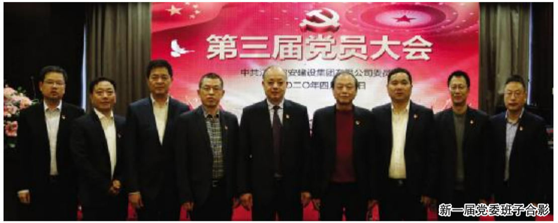
新一届党委班子合影

继续在全体党员中推进“不忘初心、牢记使命”学习教育活动,进一步解决党员队伍在思想、组织、纪律等方面存在的问题,保持党的先进性和纯洁性;要进一步加强党员教育管理,推动党内教育从“关键少数”向广大党员拓展、从集中性教