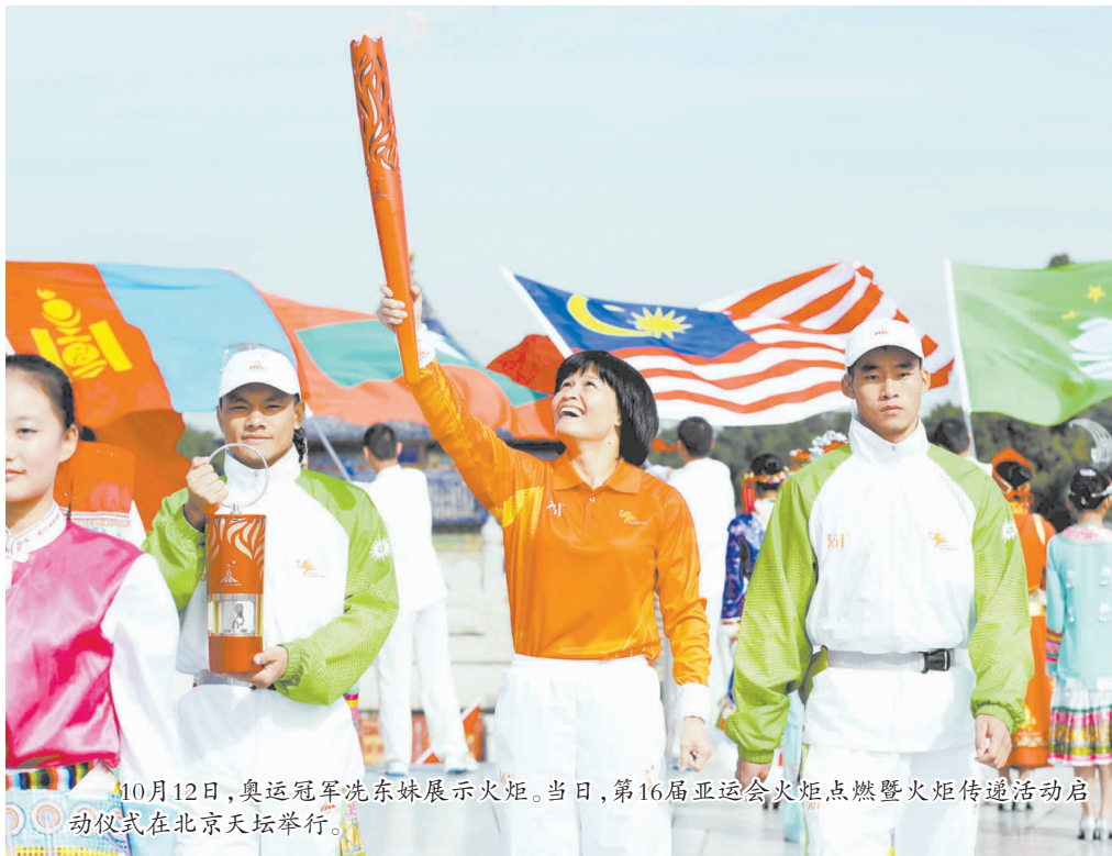
10月12日,奥运冠军冼东妹展示火炬。当日,第16届亚运会火炬点燃暨火炬传递活动启动仪式在北京天坛举行。

第16届亚运会火炬还将在哈尔滨、长春、山东海阳和广东省各地级以上城市传递,最后于11月12日抵达广州第16届亚运会开幕式现场。