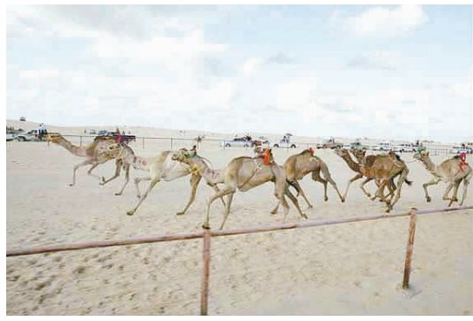
10月11日,在埃及东北部的阿里什,参加比赛的骆驼在“奋力争先”。来自沙特、科威特、苏丹、叙利亚等国家和地区的队伍参加了此次在阿里什举行的传统骆驼比赛。