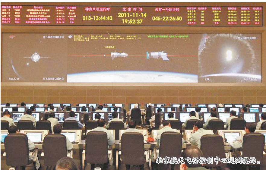
北京航天飞行控制中心观测现场。