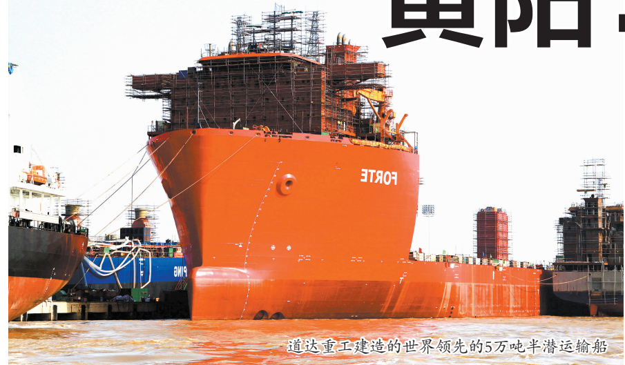
道达重工建造的世界领先的5万吨半潜运输船

人民重工、江北重工等企业进行了回购和整合,对连兴港造船实施了异地搬迁,腾龙换鸟,引进了宏华和蓝岛等重特大装备、船舶配套项目。