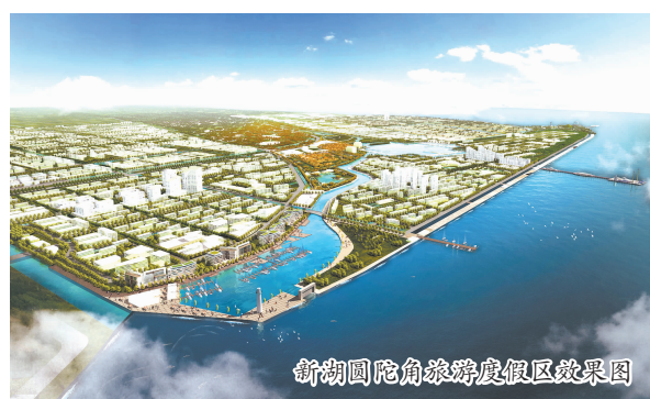
新湖国际角砾度假区效果图