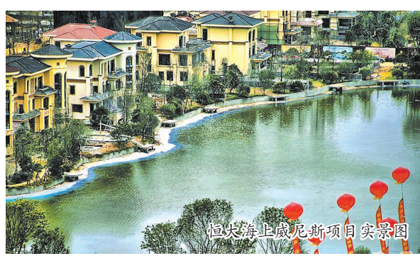
恒大海上威尼斯项目实景图

华表示,下阶段,寅阳镇将重点推进宏华海洋、蓝岛海工等企业快产出,年底前,力争实现沿江企业一期工程全部竣工投产,确保沿江全年实现应税销售60亿元。同时,召开好上海招商推介会和船舶配套专题招商会,实现项目储备落户的大提升。