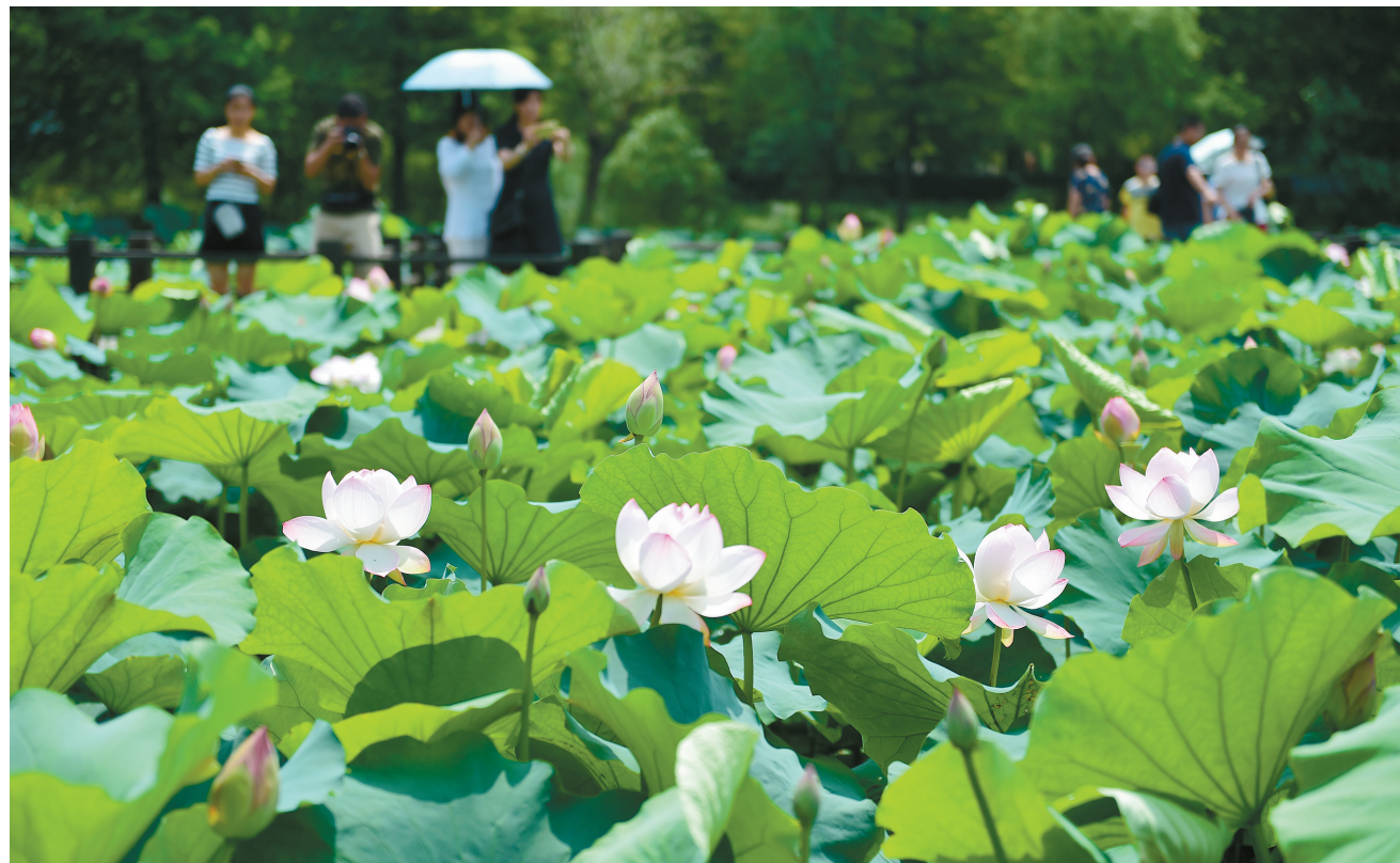
夏至过后，紫薇公园荷花池里的荷花竞相盛开。6月26日，市民们在荷塘边观赏和拍摄荷花盛开的美景。

检察工作、支持检察工作，同时也消除了社会各界对检察工作的神秘感，增强了群众对检察工作的认知度，加强了与人大代表、政协委员和人民群众的联系，取得了良好的社会效果。(刘嘉怡)