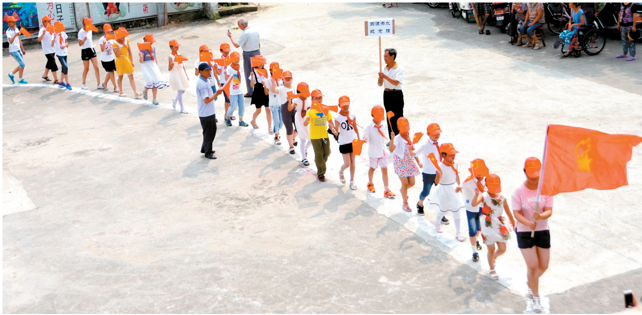
7月19日,汇龙镇临江村举办“七彩夏日童心向党”纪念红军长征胜利80周年活动。20多名少先队员在校外辅导员和村支书带领下,挥舞着国旗,重走“长征路”,体会和了解当年革命前辈的战斗历程。