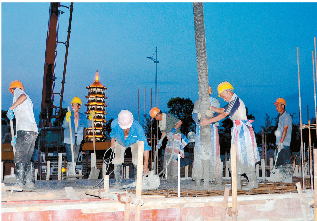
位于华山路南苑东路交汇处的夜排档建设项目,是市政府实施的一项为民实事工程。该项目总投资1000万元,占地4000余平方米,于今年6月初开工,预计11月底竣工。图为8月24日晚,工人挑灯夜战。

为追求创建实效,汇龙镇创新活动形式,今年开展了“关爱贫困群众送温暖”等10多个主题活动。如“邻里守望、情暖夕阳”活动,各村通过排摸梳理出70岁以上孤寡老人、失独家庭,建立服务名册,落实服务人员,从与老人上门陪聊、水电修理