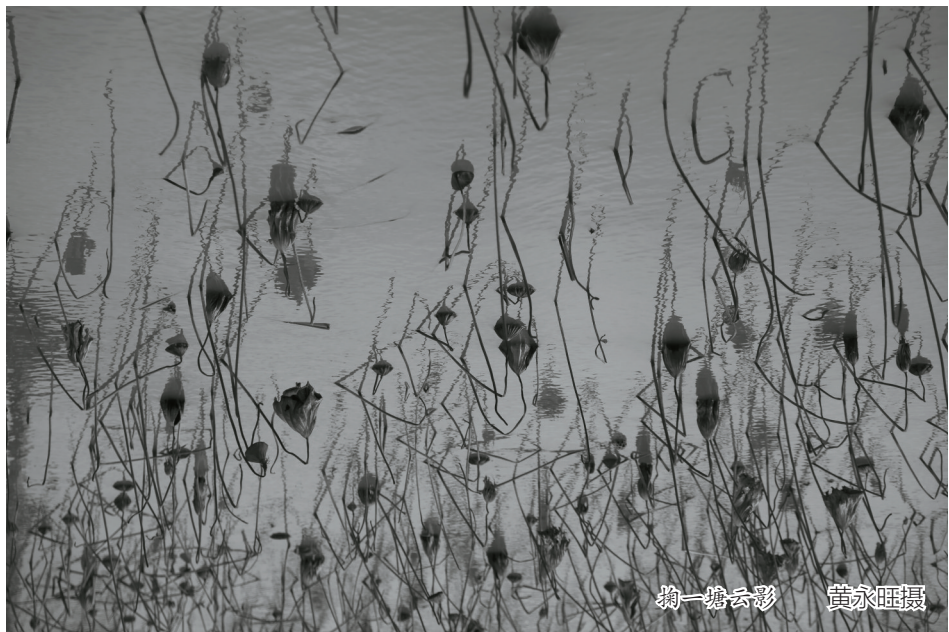
掬一塘云影