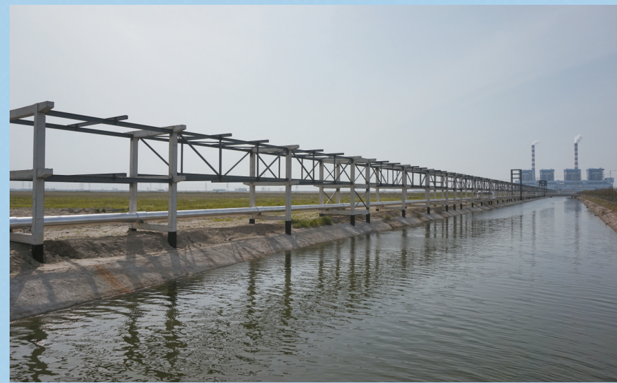
新材料产业园管廊建设