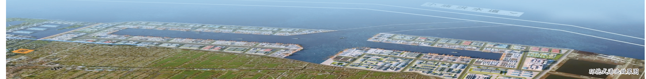
环抱式港池效果图