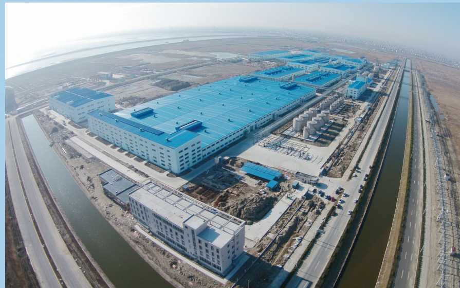
江苏启东华峰超纤厂区

头、进港铁路、污水处理、集中供热等重大工程。推进一类口岸开放功能建设，港口开发尽快实现从基础设施建设向经营管理转变。镇区全力推进省级新型城镇化试点、特色景观旅游名镇创建，至“十三五”末，城市化率达60%以上。积极规划建设新型社区、中央商务区、旅游度假区等功能区，吸引国际性的金融、商贸、物流等服务业企业入驻，增强城市对港口和产业的配套功能。