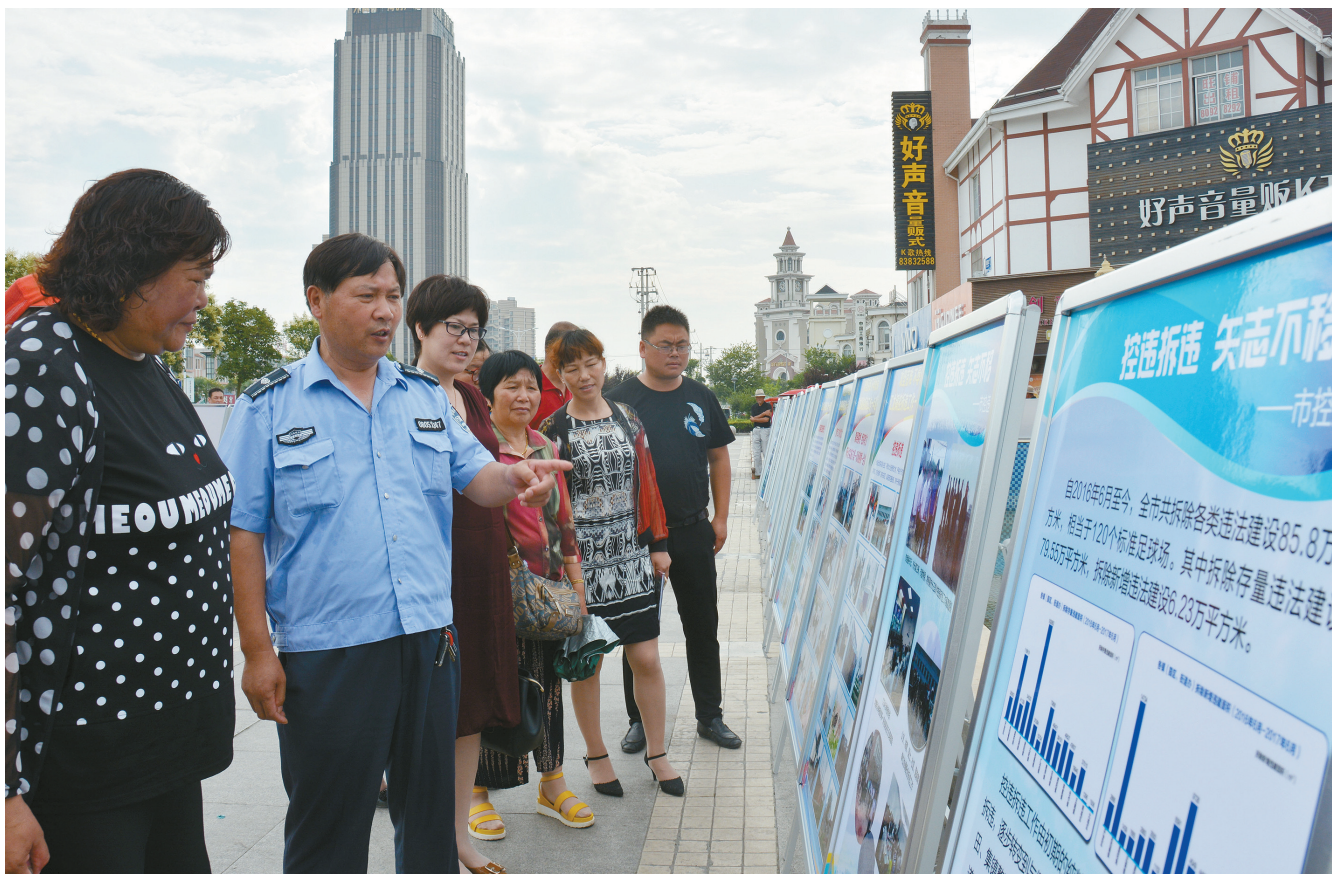
7月5日,市控违办开展控违拆违工作成果巡展。在首站近海镇,现场展出的77块宣传展板,展示了全市各地一年来取得的控违拆违成果。