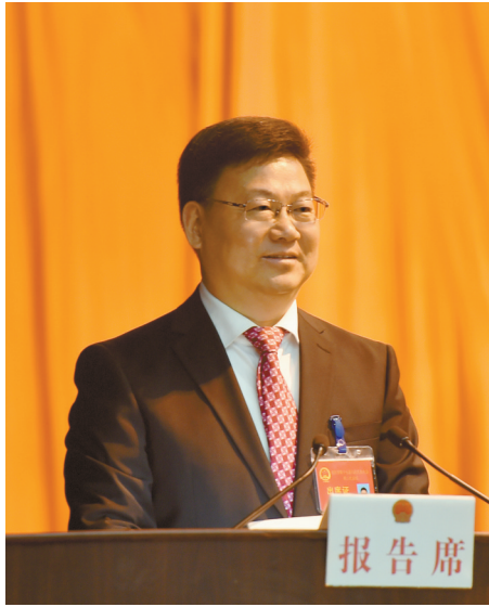
黄卫锋作政府工作报告

建议今年全市经济社会发展的主要预期目标为： 地区生产总值增长8%左右，一般公共预算收入完成72.3亿元，全社会固定资产投资增长8%以上，全社会研发投入占地区生产总值比重达2.57%，社会消费品零售总额增长10%左右，进出口总额实现适度增长，城乡居民人均可支配收入增长快于经济增长，节能减排完成上级下达目标任务，大气、水等环境质量持续改善。