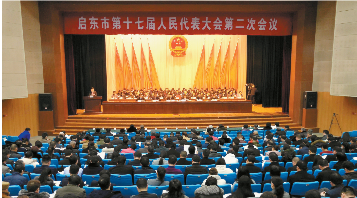
启东市第十七届人民代表大会第二次会议在市会议中心隆重开幕