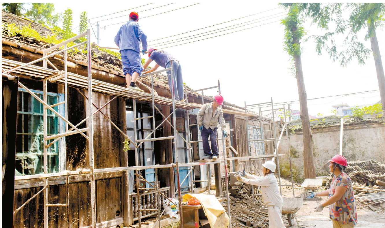
7月9日上午,位于吕四港镇的进士府修复工程正在进行。据了解,该进士府是清光绪年间吕四进士李馨硕的故居,由其父亲李芸晖始建于1873年,为占地310平方米的三进两院式官宅。今年,吕四港镇拨款近200万元对其进行修复,修复工程预计在2019年完工。

政协委员的这一提案得到了市政协的高度重视,被列为今年市政协的重点提案之一。3月至4月,市政协先后两次召开由市城管局、公安局的相关负责人、具体承办人参加的专题会议,协商整治方案和后期长效管理措施,拟定整治通告。5月11