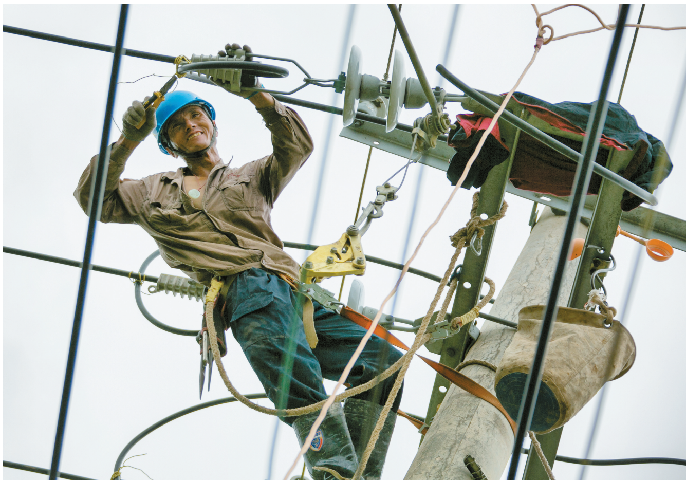
9月17日上午,受强雷电暴雨影响,王鲍镇天星村一10千伏线路断线,市供电公司立即派人紧急抢修,经过3个多小时的紧张奋战,于12时30分恢复正常供电。

本报讯 近日,长龙三村社区组织开展“弯腰一秒 清洁家园”志愿活动。志愿者带着收集袋、铲子等工具,重点清理绿化带内的白色垃圾,积极营造整洁社区环境。(王健 姜新春)