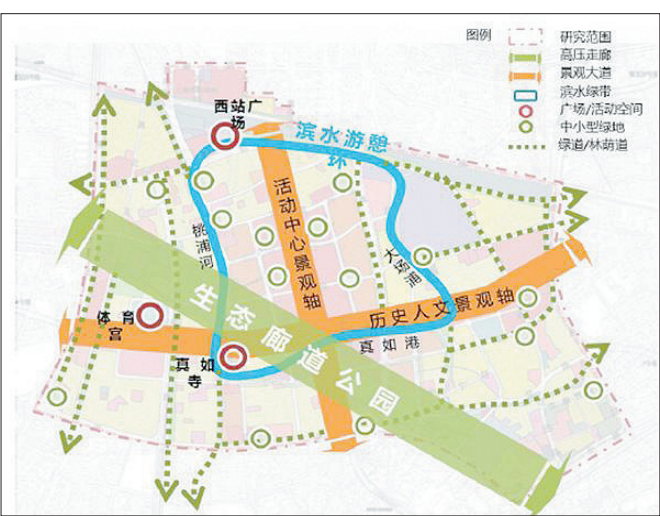
真如城市副中心一廊一环、十字轴线规划图

真如副中心的建设过程中,将会延续真如历史文化,保护延续以真如古寺、真如古镇为代表的历史文化资源,延续发扬以真如羊肉、铜川水产为代表的美食文化资源,保护利用以银杏古树、真如港、梨园浜为代表的生态文化资源;创造利用上海西北地区特有的历史风貌与现代都市旅游文化融合的旅游资源。