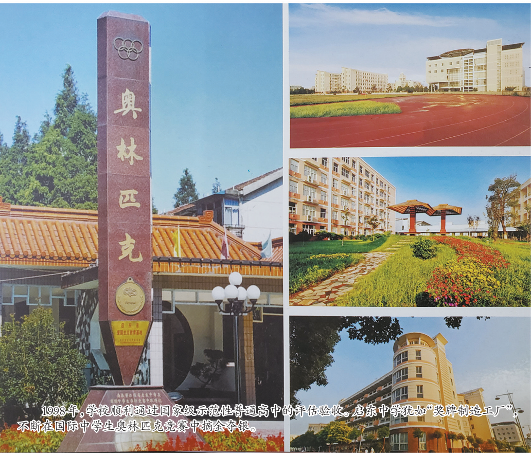
1998年,学校顺利通过国家级示范性普通高中的评估验收。启东中学犹如“奖牌制造工厂”,不断在国际中学生奥林匹克竞赛中摘金夺银。