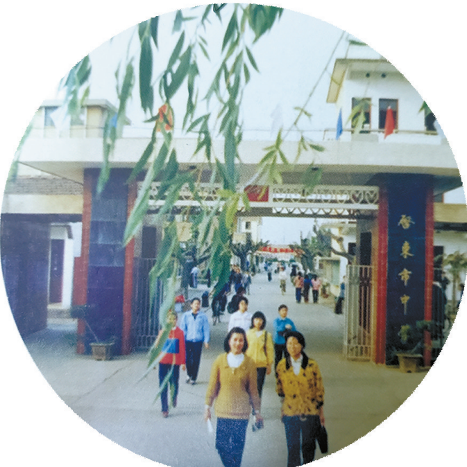
1990年2月15日,启东撤县建市,启东县中学更名为启东市中学。(资料图片)