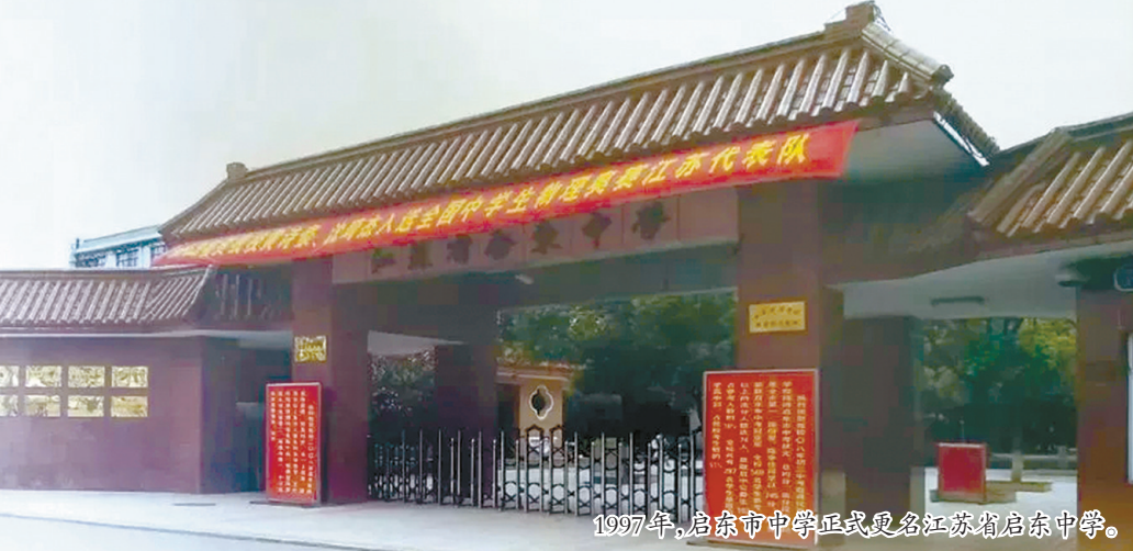
1997年,启东市中学正式更名江苏省启东中学。