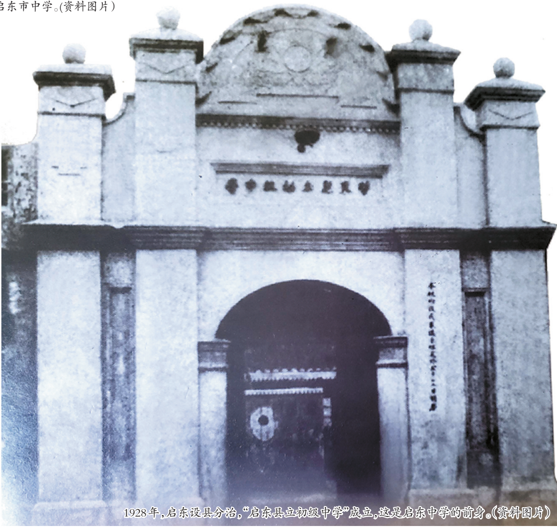
1928年,启东设县分治,“启东县立初级中学”成立,这是启东中学的前身。(资料图片)