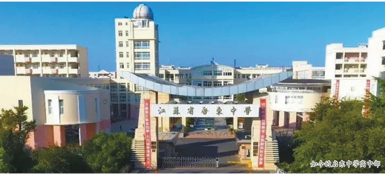
如今的启东中学高中部