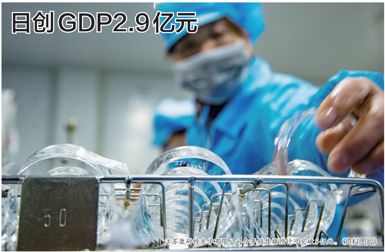
江苏康耐特光学有限公司今年销售额预计可突破5亿元。(资料图片)