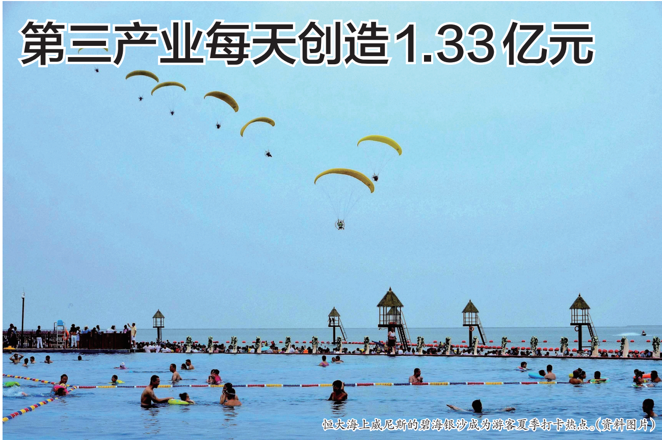
恒大海上海成尼斯的碧海金沙成为游客夏季打卡热点。(资料图片)