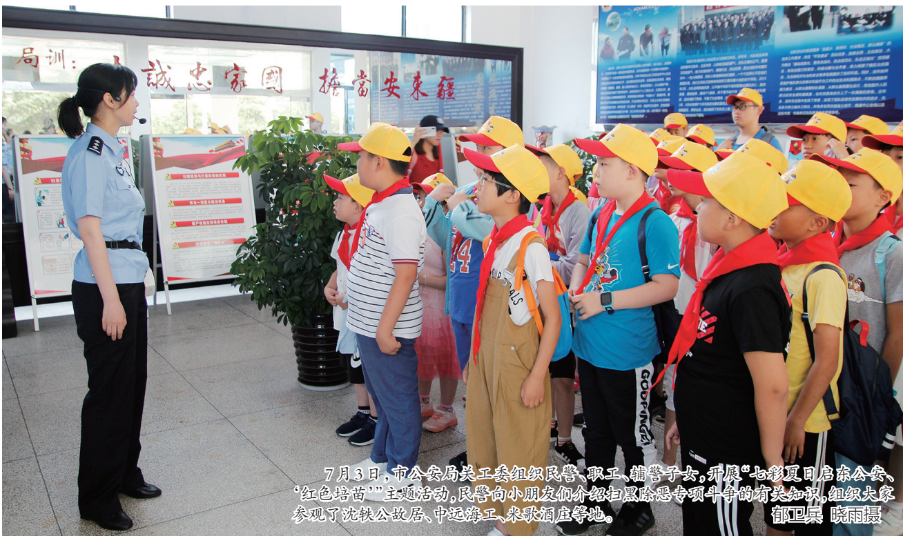
7月3日,市公安局关工委组织民警、职工、辅警子女,开展“七彩夏日启东公安·红色培苗”主题活动,民警向小朋友们介绍扫黑除恶专项斗争的有关知识,组织大家参观了沈铁故居、中远海工、民歌酒店等地。

本报讯 近日,紫薇二村社区组织党员参观江海清风园廉政教育基地。党员们参观了百廉百福墙、廉政文化宣传栏、廉政书画墙等,纷纷表示要自觉做到警钟长鸣、拒腐防变、干净做事。(陈柳清)