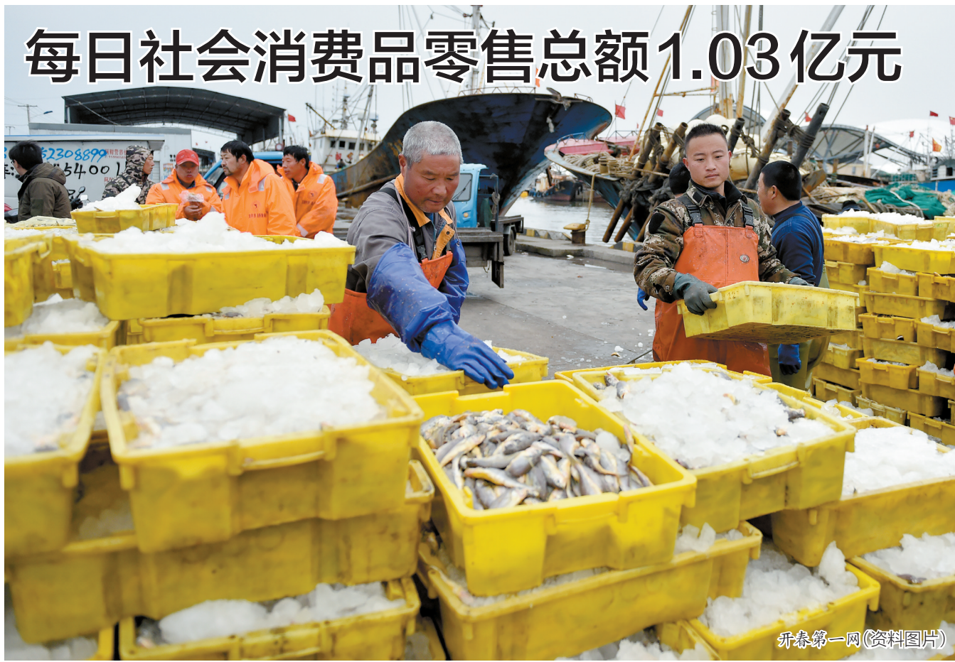
开春第一网(资料图片)