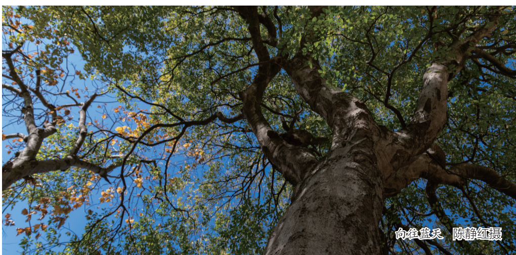
向俊盘采