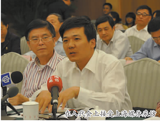
在人大会议上接受上海媒体采访