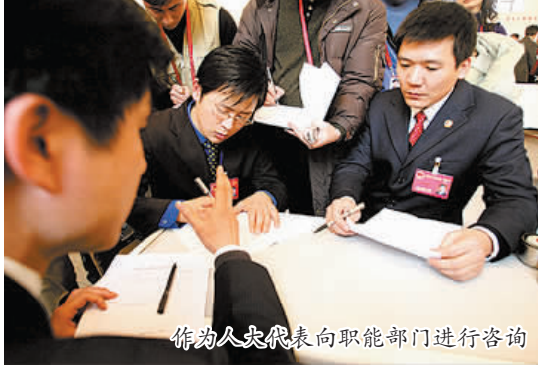
作为人大代表向职能部门进行咨询