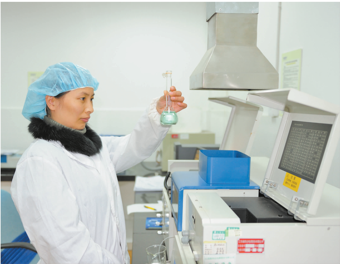
本版撰稿 戴丽丽 李净