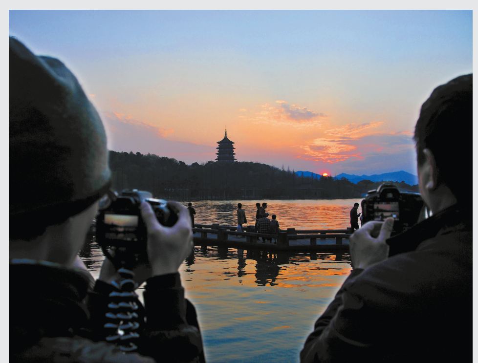
3月23日，两位摄影爱好者正在拍摄杭州西湖十景之一的“雷峰夕照”。春季是杭州的旅游旺季，前往杭州赏樱花逛西湖的人多了起来，也吸引了一批摄影爱好者前来采风。