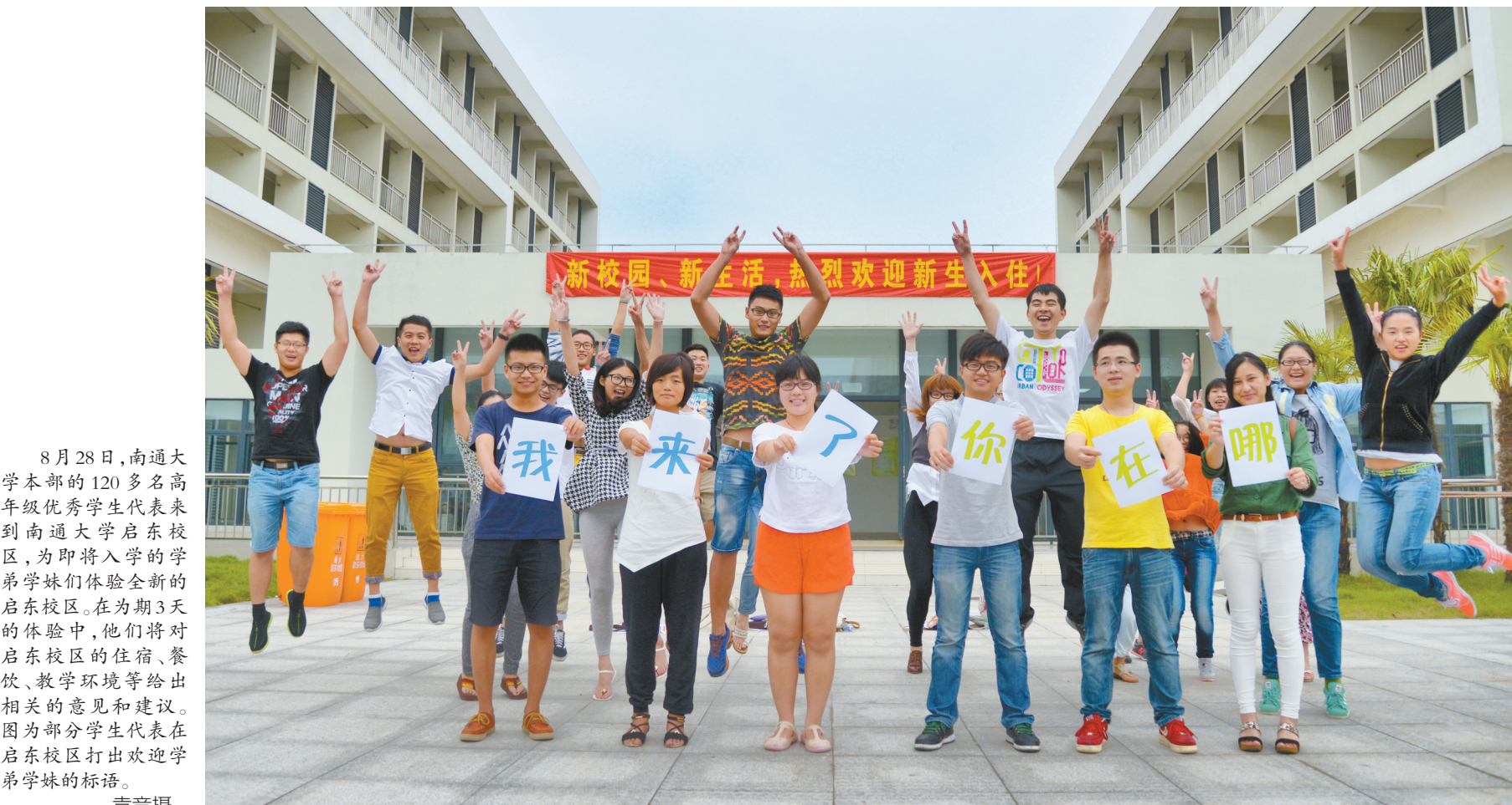
8月28日,南通大学本部的120多名高年级优秀学生代表来到南通大学启东校区,为即将入学的学弟学妹们体验全新的启东校区。在为期3天的体验中,他们将对启东校区的住宿、餐饮、教学环境等给出相关的意见和建议。图为部分学生代表在启东校区打出欢迎学弟学妹的标语。

为丰富全市未成年人暑期生活,促进广大未成年人健康成长,市文明办、教育局、关工委等部门每年都组织开展“七彩夏日——未成年人暑期系列活动”。今年,以践行社会主义核心价值观和未成年人文明礼仪养成教育为主线,开展了内容丰富、形式多样的活动,充分展示了我市文明礼仪养成教育的风采,为广大中小学生在送上丰富的精神盛宴。据不完全统计,全市3万余名未成年人参加了活动。(黄佳惠)