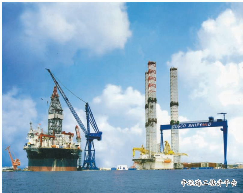
中远海工钻井平台

今年以来,规模工业应税销售、规模工业总产值、高新技术产值、新兴产业产值、实际到账外资、公共财政预算收入等主要经济指标完成良好,走在全市园区前列。着力推进重大项目建设。计划总投资19.8亿元的京沪重工大型特种钢结构制造项目已经完成对原有厂区房屋、设备维护与整修,已承接宜兴范蠡大桥钢结构分段制作业务。宏强重工、太平洋特殊海洋装备制造、胜狮近海集装箱制造等项目加快推进。安全生产做细做实。严格落实安全生产“一岗双责”、“党政同责”制度。开展好重点领域、重点时段的安全生产专项整治工作。功能配套加快推进。围绕中心功能区和“一横三纵”主干道建设。海工大道、海工中路等平主要道路建设接近尾声。人居环境持续改善。投入700多万元,实施农村公路亮化全覆盖工程,安装农村球路、中心路路灯7000多盏,总里程超350公里。同时,做好协调发展。认真做好正能量加油站建设、南通市“诗词之乡”创建、“舞动寅城”、“活力寅城”等工作,启动寅城欢歌文艺节目的演出等等。