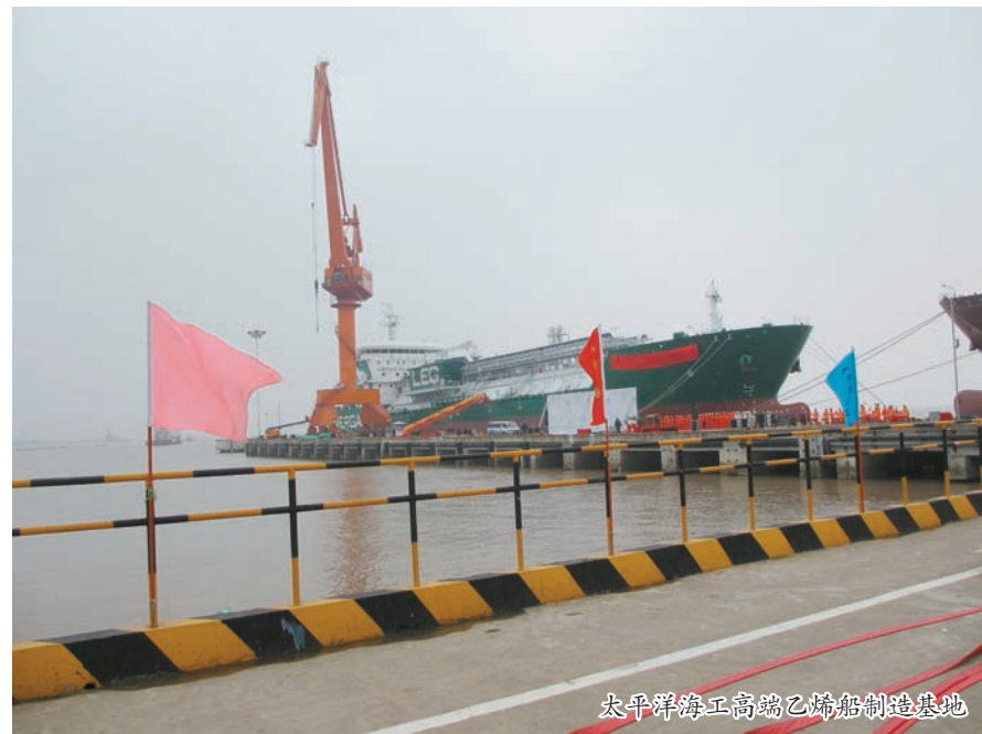
太平洋海工高端乙烯船制造基地