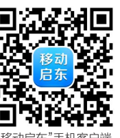
“移动启东”手机客户端