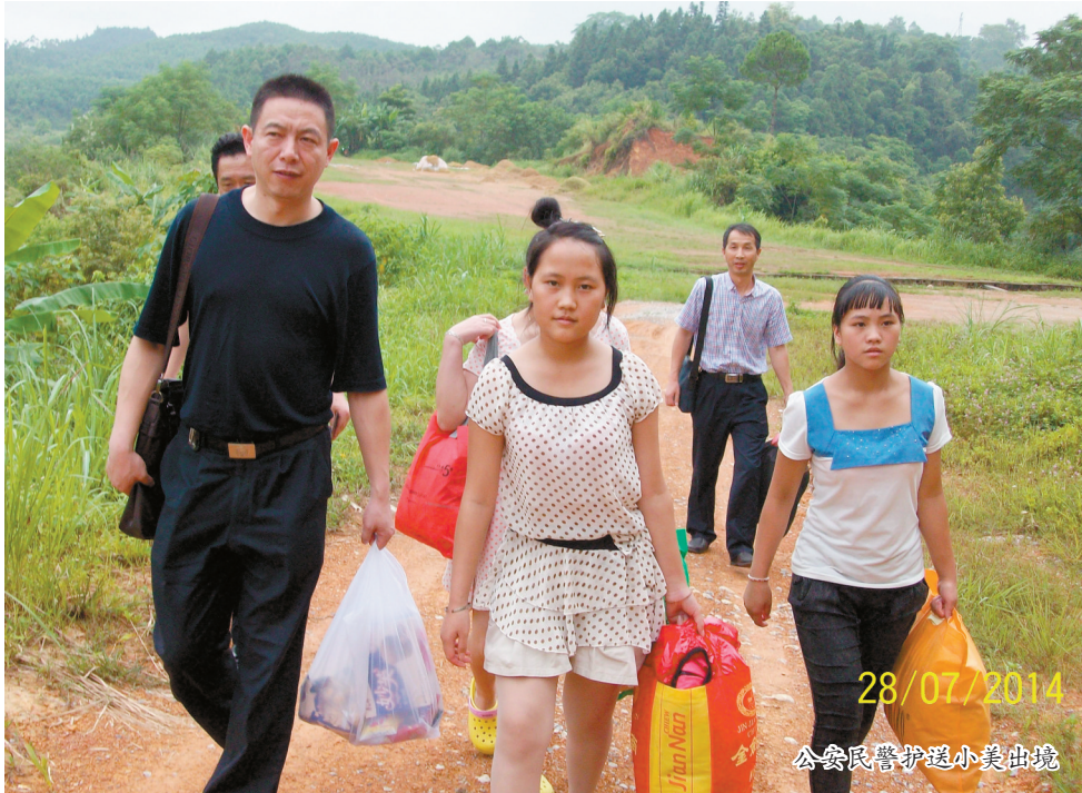
28/07/2014 公安民警护送小美出境