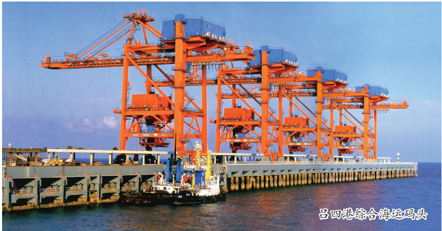
吕四港综合海运码头