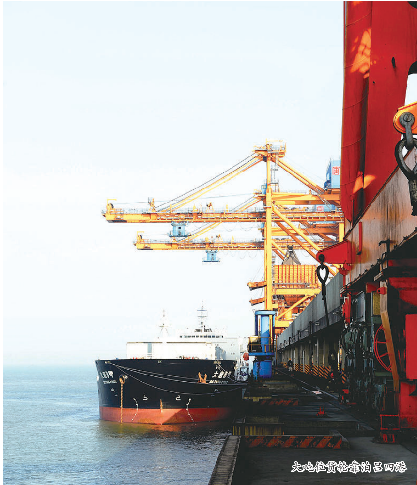
大吨位货轮靠泊吕四港

随着启东港一类口岸的开放,启东经济社会发展全面进入“大港时代”。通江达海的优良深水港口、科学超前的发展规划、日益完善的基础设施、四通八达的交通网络,令启东区位优势更加凸显,必将助推启东在更大范围、更宽领域、更高层次上走向蓝色文明,登上世界舞台。这对于促进江苏沿海开发和长三角一体化战略的深入实施以及提升苏中地区开放型经济发展水平具有重要作用。进入“大港时代”的启东,必将在神奇的长江入海口再创令世人震惊的新奇迹。