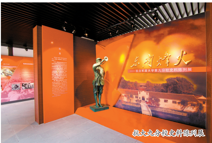
抗大九分校史料陈列展