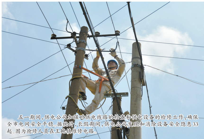
五一期间,供电公司加强对供电线路的检查和供电设备的检修工作,确保全市电网安全平稳。据统计,长假期间,供电公司发现和消除设备安全隐患33起。图为抢修人员在王鲍镇维修线路。