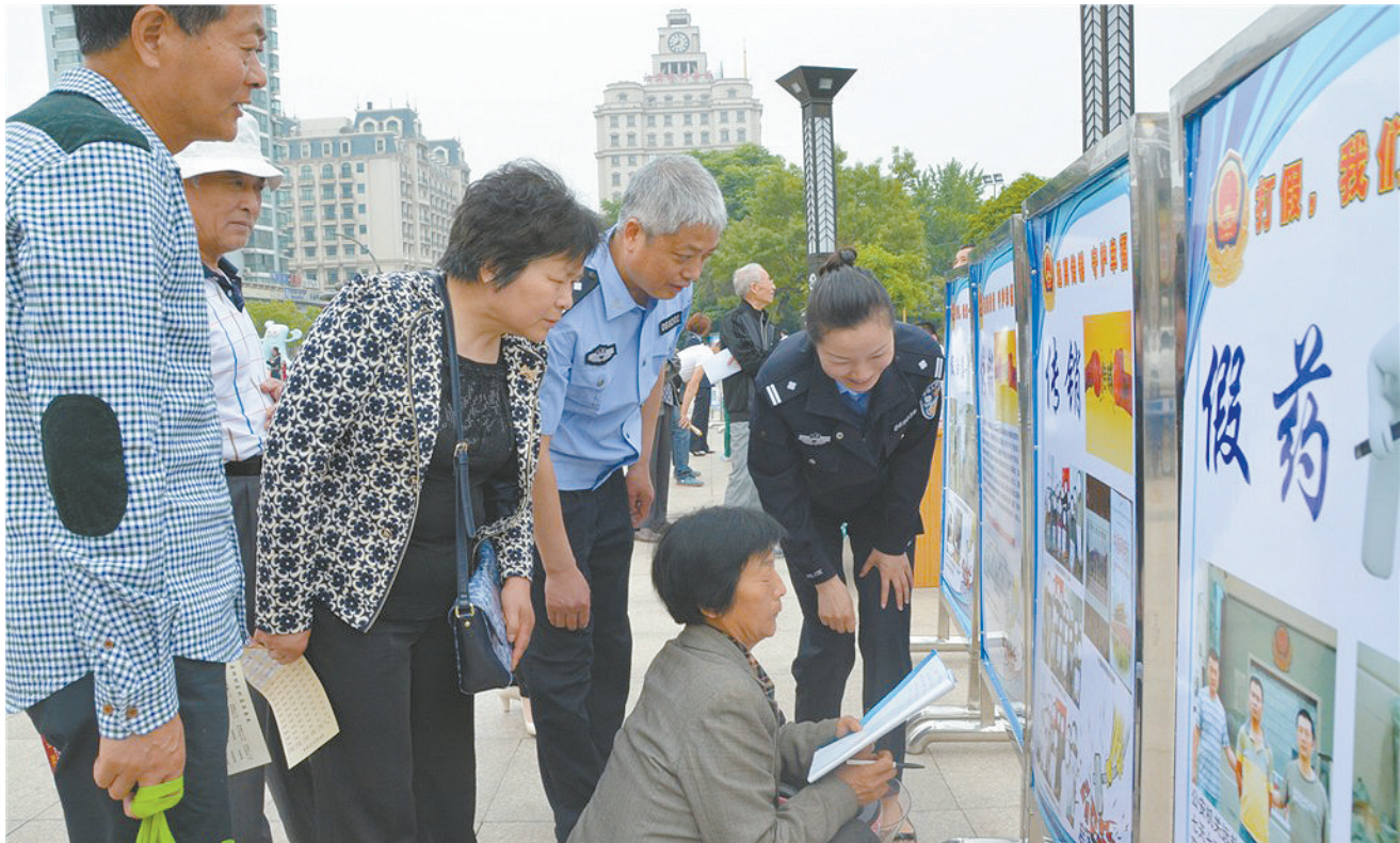
近日,市公安局经侦大队会同税务、盐务、质监、人民银行等部门组织开展了打击和防范经济犯罪宣传系列活动。活动以“打击经济犯罪,识假防骗,共创平安”为主题,使群众了解假币、代开假发票、银行卡诈骗、非法传销、非法集资等各类经济犯罪的手段、特点,掌握防范技巧,赢得了群众的广泛参与和称赞。