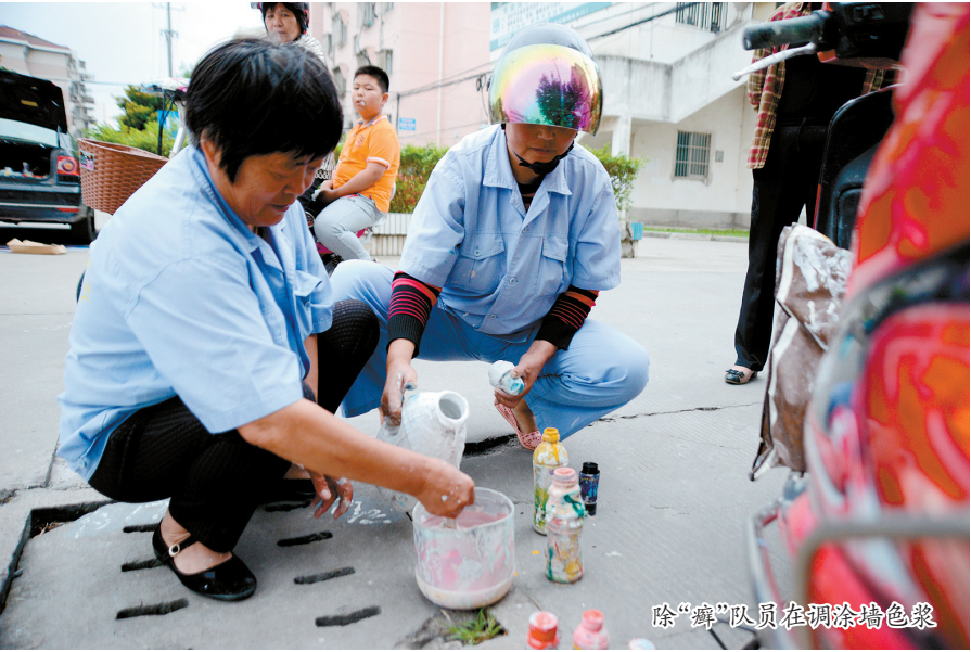
除“癣”队员在调涂墙色浆

市容管理科的工作人员表示,治理小广告,光靠城管部门一家,显然力量远远不够。尤其对于那些假发票、假证等非法信息的小广告,需要公安等部门联合执法,通过广告上的联系方式,顺藤摸瓜,采取行动,端掉其窝点,只有这样才能从源头上给予严厉打击,起到根治的效果。