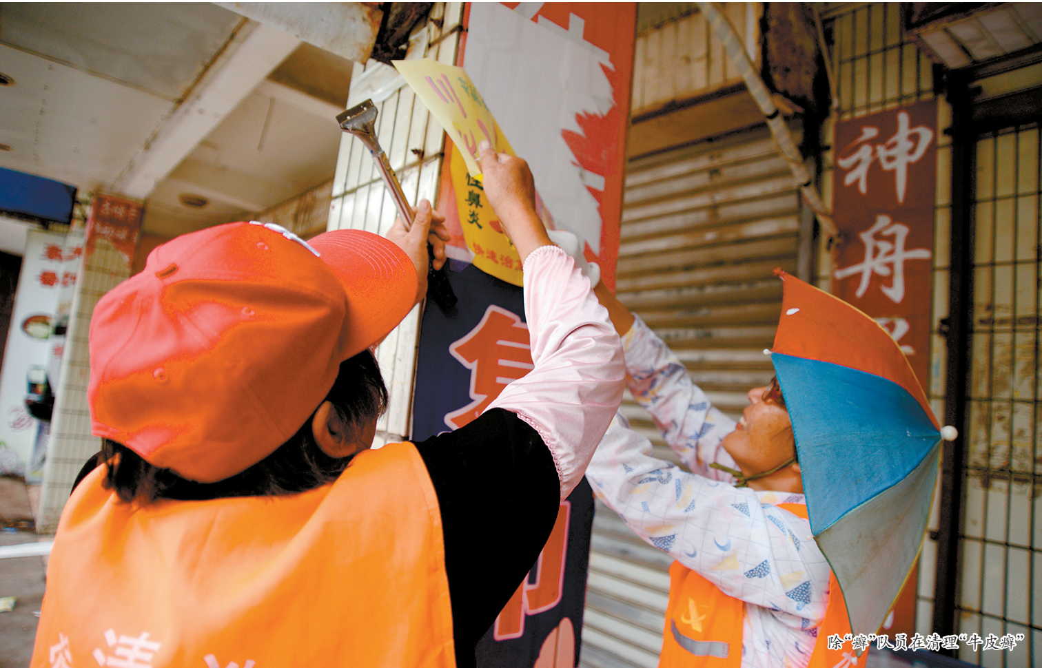
除“癣”队员在清理“牛皮癣”