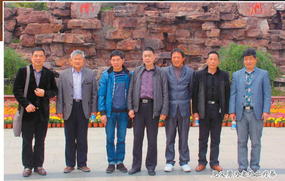
见义勇为者外出疗养

进行资金募集。目前,见义勇为基金已累计至1800多万元。见义勇为基金会通过各种媒介,将见义勇为典型的先进事迹进行广泛宣传。这些平民英雄的故事,无不感动着人们的心灵,给城市留下无数次感动。