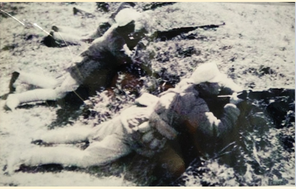
▲东南警卫团战士反“清乡”作战场景 ▼庆祝第一期反“清乡”斗争胜利宣传画

截至9月底,东南军民经过6个月的艰苦斗争,县团、区队、行动队和民兵,共有5000多人参加战斗,毙伤俘日伪军近600人;封锁和捣毁据点10个,破路14次,割电线1718斤,破坏竹篱笆45里;全县散发和张贴宣传品15万多张,参加政治攻势的群众达8万多人次,迫使263名伪军政特人员向我自首和投诚;动摇和部分瓦解日伪“清乡方”组织,使日伪第一期“清乡”宣告失败。