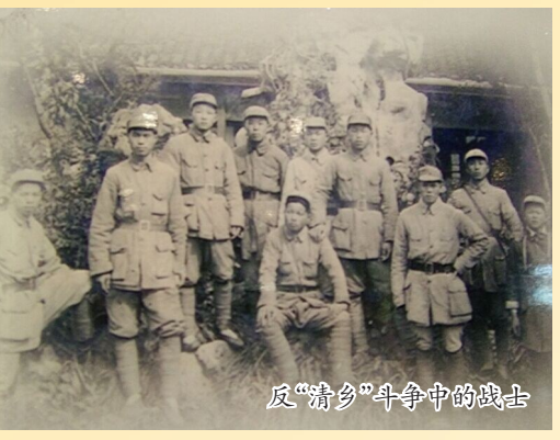
反“清乡”斗争中的战士

我东南军民从10月到11月向日伪继续发起军政攻势,开展针锋相对的斗争。10月8日凌晨,警卫团在启西区的配合下,攻克新港镇据点。10月12日夜,吕四区队镇压伪水巡团团长彭效彭,逼退杨家灶伪军。10月下旬,启西区正诗乡民兵在永阳村河西打伏击,击毙伪“清乡”警察“模范中队长”金长发。10月29日夜,正诗乡200余民兵大闹圩角镇。11月4日,正诗乡民兵再进圩角镇,杀死伪军2名。由此这个乡被群众称为打不破的“铁皮乡”。11月5日,警卫团二连一个排奔袭由南阳村返回兴隆途经东昌镇的日军森岛烧杀队,在镇南倪家仓与敌展开白刃战,继而发起追击,击溃日军20余人,森岛烧杀队狼狽逃窜。 为粉碎日伪的延期“清乡”,海