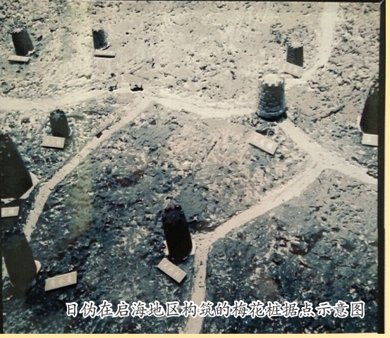
日伪在启海地区构筑的梅花桩据点示意图

1943年4月初,日伪对苏中四分区开始所谓的军事“清乡”。4月20日,日伪调集优势兵力,分南北两路开赴启海地区,派舰艇在沿江沿海巡逻,配合海门、启东、通东地区据点的日伪军,兵分九路同一天到达海中区,进行大规模的军事“扫荡”、“清剿”。日伪利用棋盘式的地形特点,采取铁壁合围和篦梳式的战术,由西往东,逐乡、逐保昼夜不停地进行搜索,拉网式向前推进。