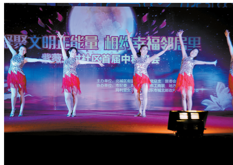
9月19日晚,“凝聚文明正能量 相约幸福邻里”紫薇三村中秋晚会在城北邮政所广场举行。舞蹈、独唱、小品、乐器独奏等12个精彩节目,赢得掌声不断。