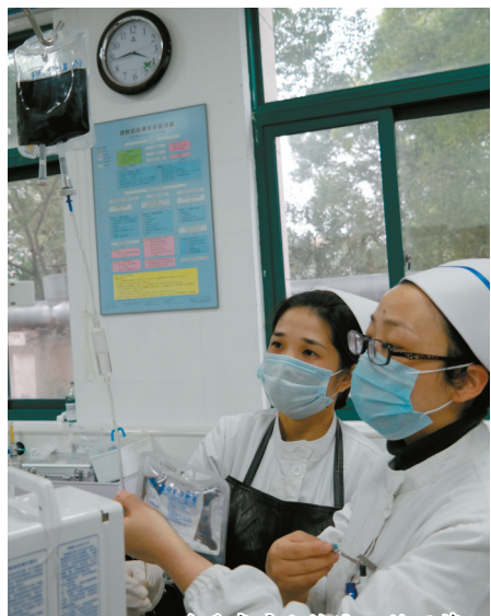
为重危病人输液一丝不苟