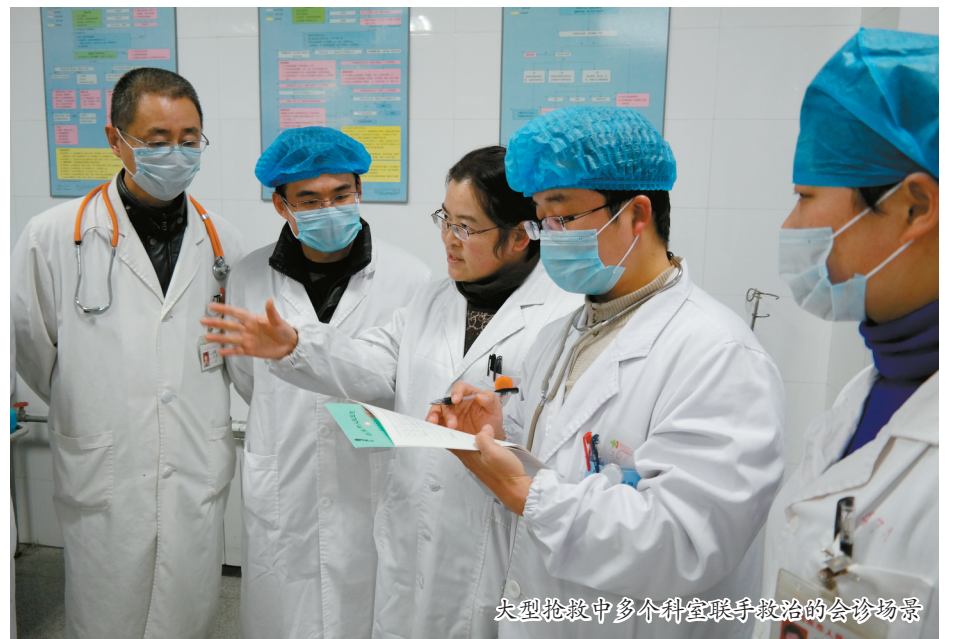
大型抢救中多个科室联手救治的会诊场景

是在吃饭还是在深夜睡觉,只要病人需要,就会尽最快速度赶到现场,如海难事件、大型车祸、群体中毒等等,总有“120”急救中心的医务人员战斗在第一线。每逢节假日,每家都团聚在一起享受天伦之乐时,“120”