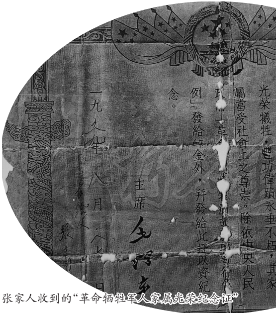
张家人收到的“革命牺牲军人家属光荣纪念证”