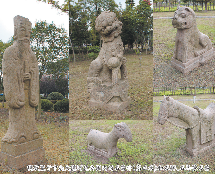
现放置于中央大道河边公园内的石翁仲(高三米)和石狮、石马等石兽